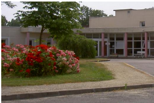
La Roseaie Avenue de l'Europe