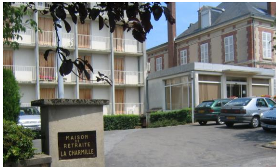
La Charmille 26 av de la République

ETABLISSEMENT D'HEBERGEMENT POUR PERSONNES AGEES DEPENDANTES